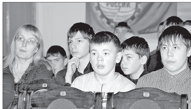
Конференция вызвала большой интерес у школьников

1 декабря в Доме техники Севмаша состоялась научно-практическая конференция «Севмаш для молодёжи», организованная советом молодых специалистов для северодвинских школьников.