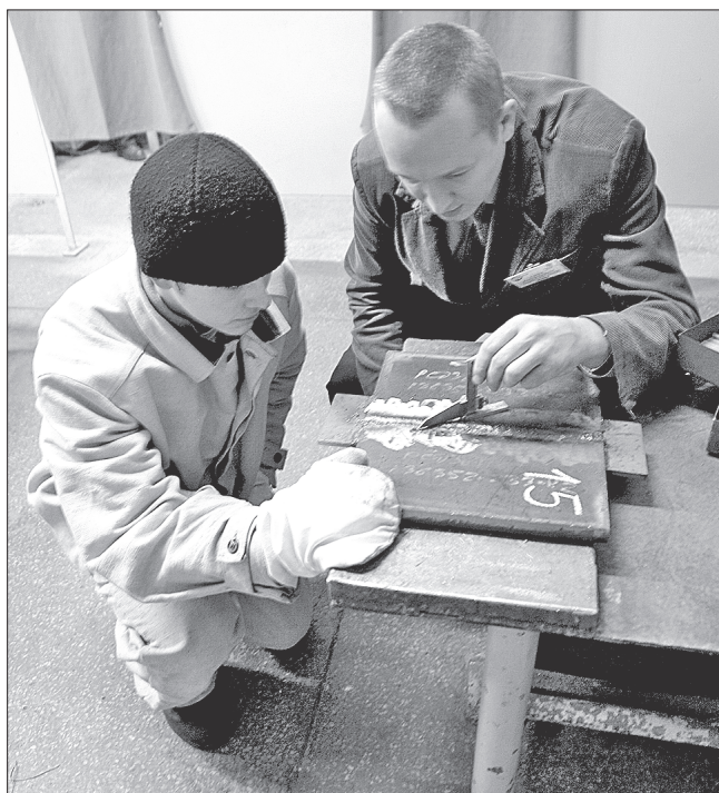
Сварной шов оценивали и визуальнo, и при помощи инструмента

тем, с другой стороны, в нижнем (пластина лежит на столе). Величина и характер шва должны соответствовать нормам. Качество работ оценивали как визуальнo, так и посредством ультразвукового контроля. В конце участников ждало теоретическое задание – проверка знаний по нескольким техническим